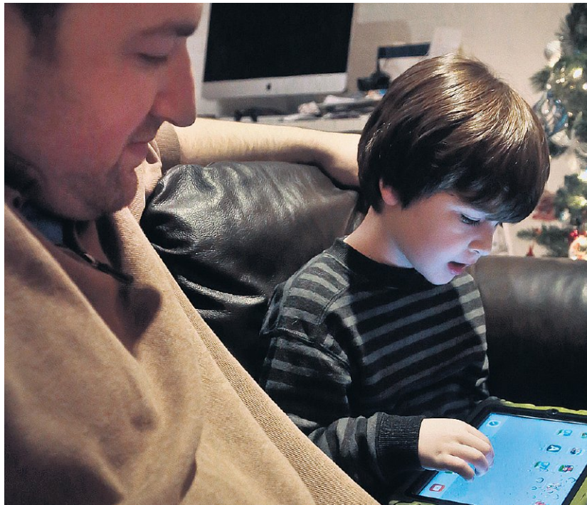
Er is slechts een kleine groep jongens die gewelddadig wordt van games.

Toch is er wel wat aan de hand. De huidige jeugd zit gemiddeld zes uur per dag voor, achter of boven een scherm, zeven dagen per week. Dat is meer tijd dan ze op school doorbrengen. Vandaar dat het boek deze jeugd omschrijft als 'schermgaande jeugd' als variant op